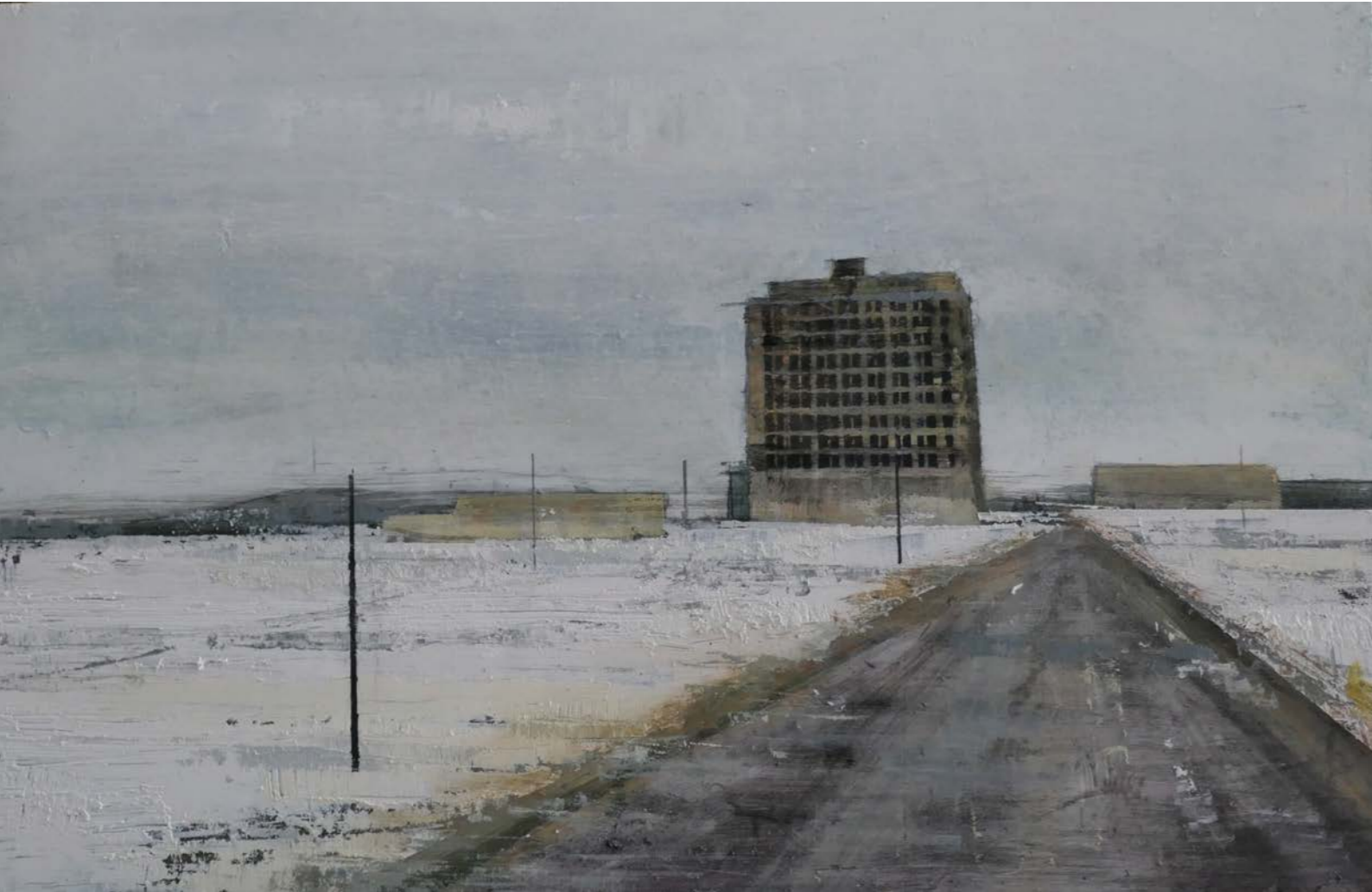
Invierno, Rusia Oli sobre fusta | 152 x 80 cm