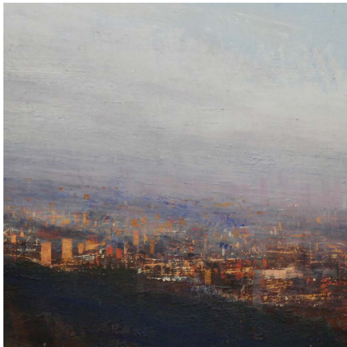
Bogotá, efecto de tarde Oli sobre fusta | 85 x 85 cm