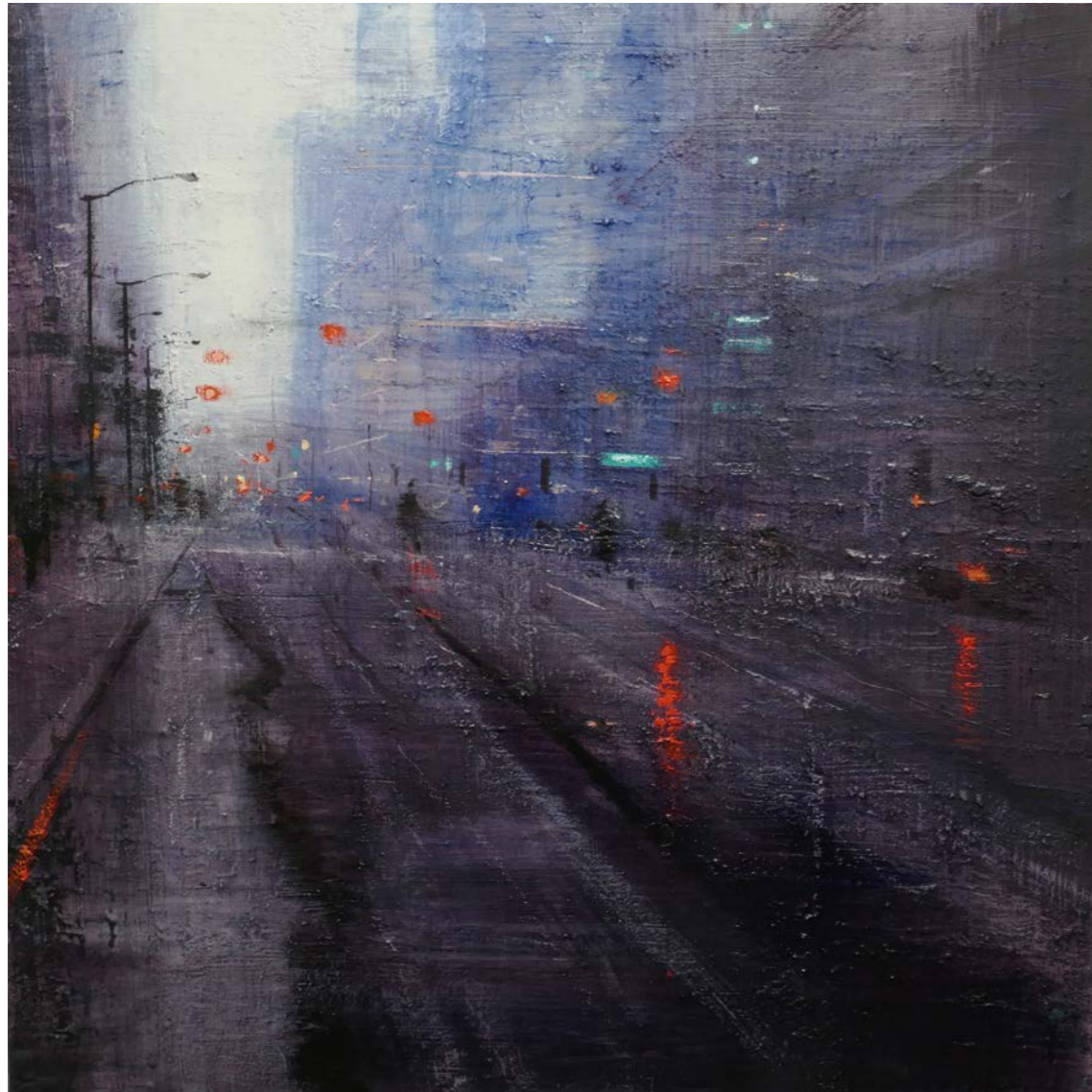
Night blue and lights Oli sobre fusta | 85 x 85 cm