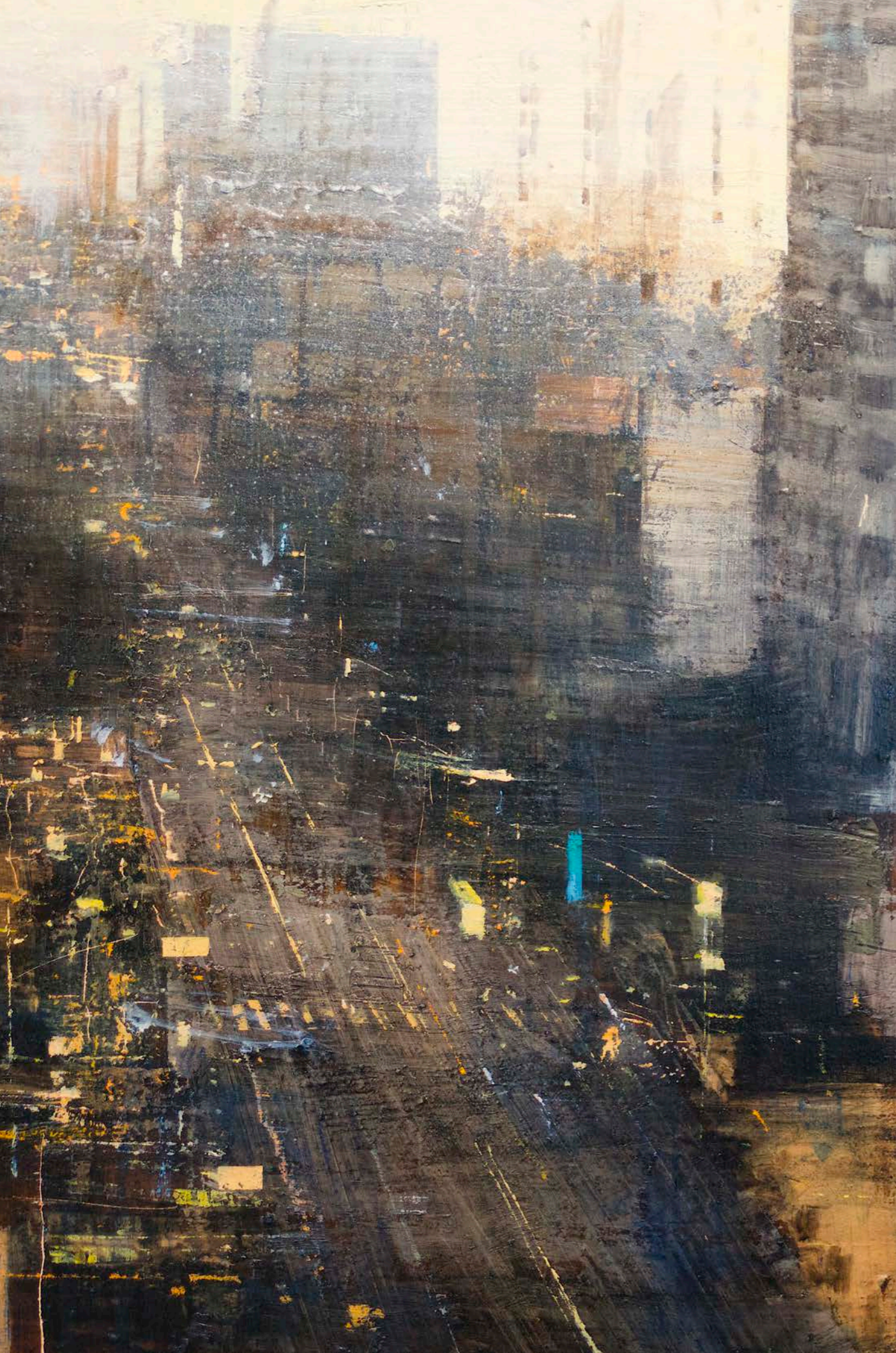
Trafico urbano | Oli sobre fusta | 75 x 50 cm