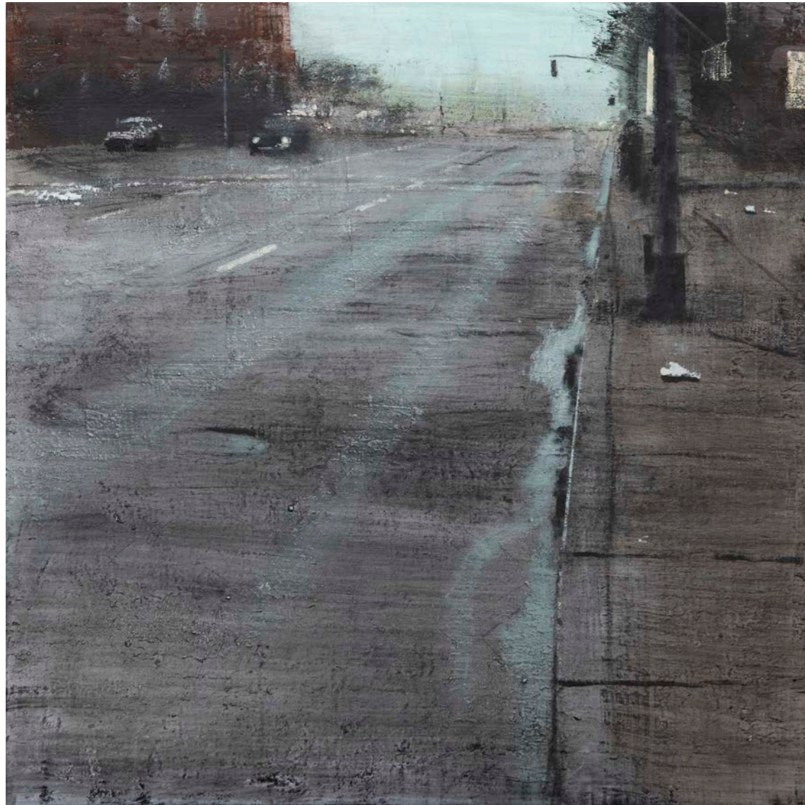
Calle mojada Wet street Oli sobre fusta | 60 x 60 cm